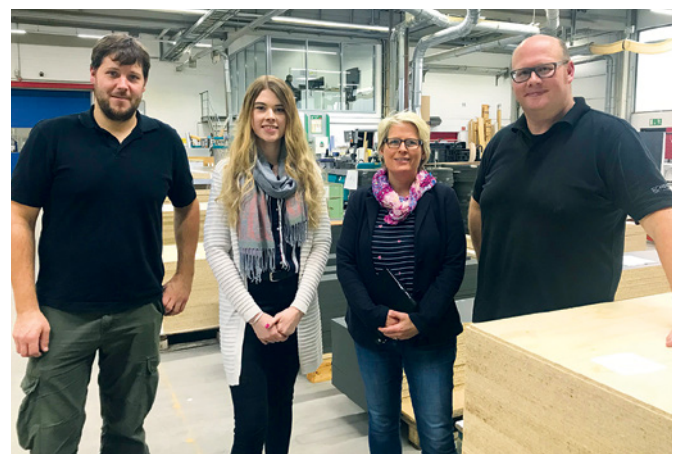
Das SCHEMBERG Umweltteam

Nachhaltiges Handeln verbunden mit der stetigen Verbesserung aller Leistungen ist gelebtes Unternehmensmotto. Als dynamisches Unternehmen entwickelt SCHEMBERG die eigenen Ziele stetig weiter. Denn nur durch ständige Anpassung aller Produkte an die Bedürfnisse der Kunden sind langfristige Erfolge zu erreichen.